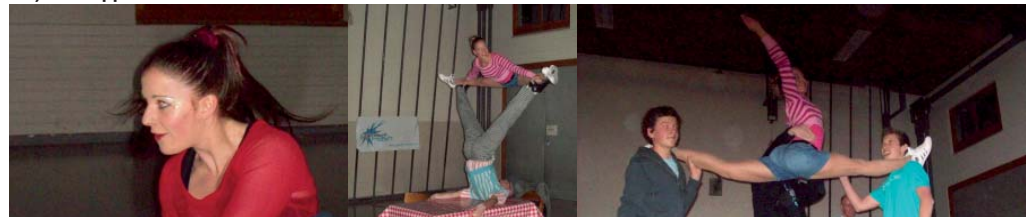
2.g) Akrobatik- und Tanzshow