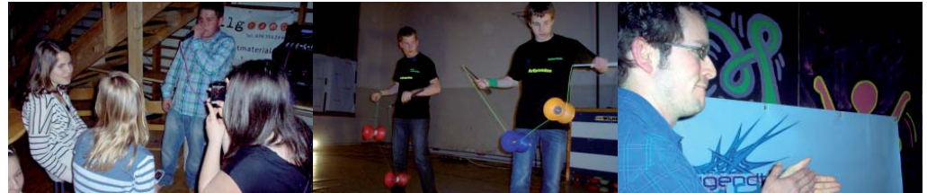
2. a) Jubiläumsparty mit Logo-Neueinweihung