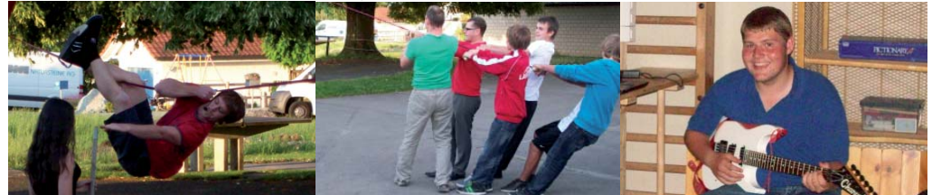
2. b) Comicshow