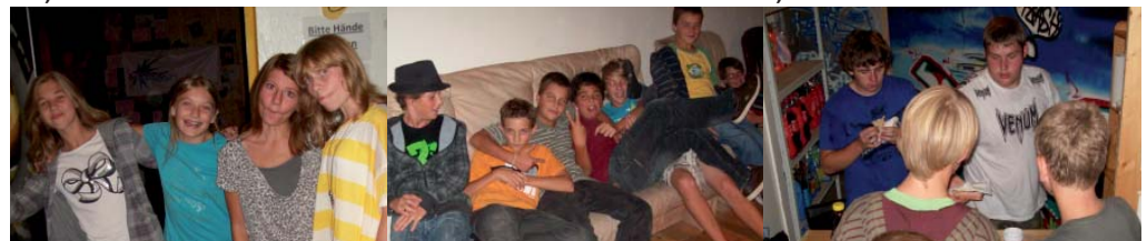
2. f) Schnupperabend