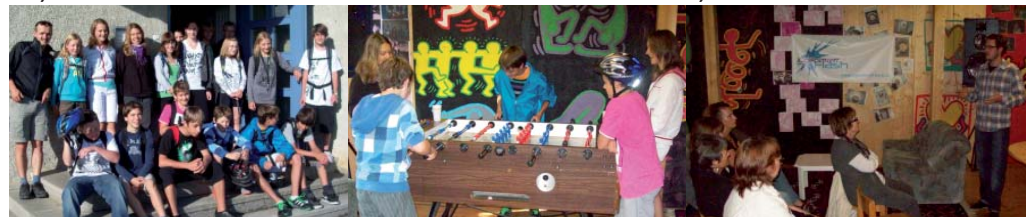
2. d) Kennenlertour